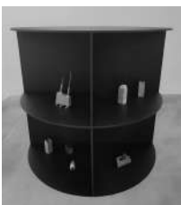
Esfera abierta 2019-2024 180 x 200 cm