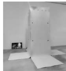
Torre N.Y. En blanco y negro, confinamiento 2021, 380 x 430 x430 cm