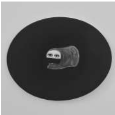
Madre Luna 1996-1997, 41 x 56cm