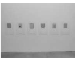
Serie Andaquilla 2020-2021, 75 x 52,5 cm