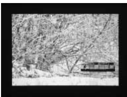
Nieve en Saro 2004-2007, 19:05 min.