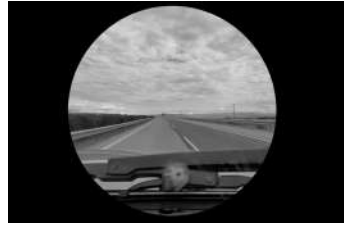
Ocelo 2021, 5 min. 40 seg.