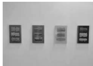
Serie Entropia en Saro 2021, 66 x 44 cm