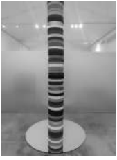
Eje Polar, 2016 644 x 200 cm