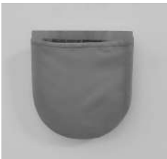
Bolsillo-Espejo 1994, 20 x 17 cm