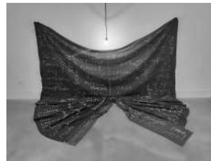
Sudario, 1998 500 x 280 cm