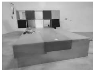
Sketch para soñador de islas 1994, 230 x 550 x 260 cm