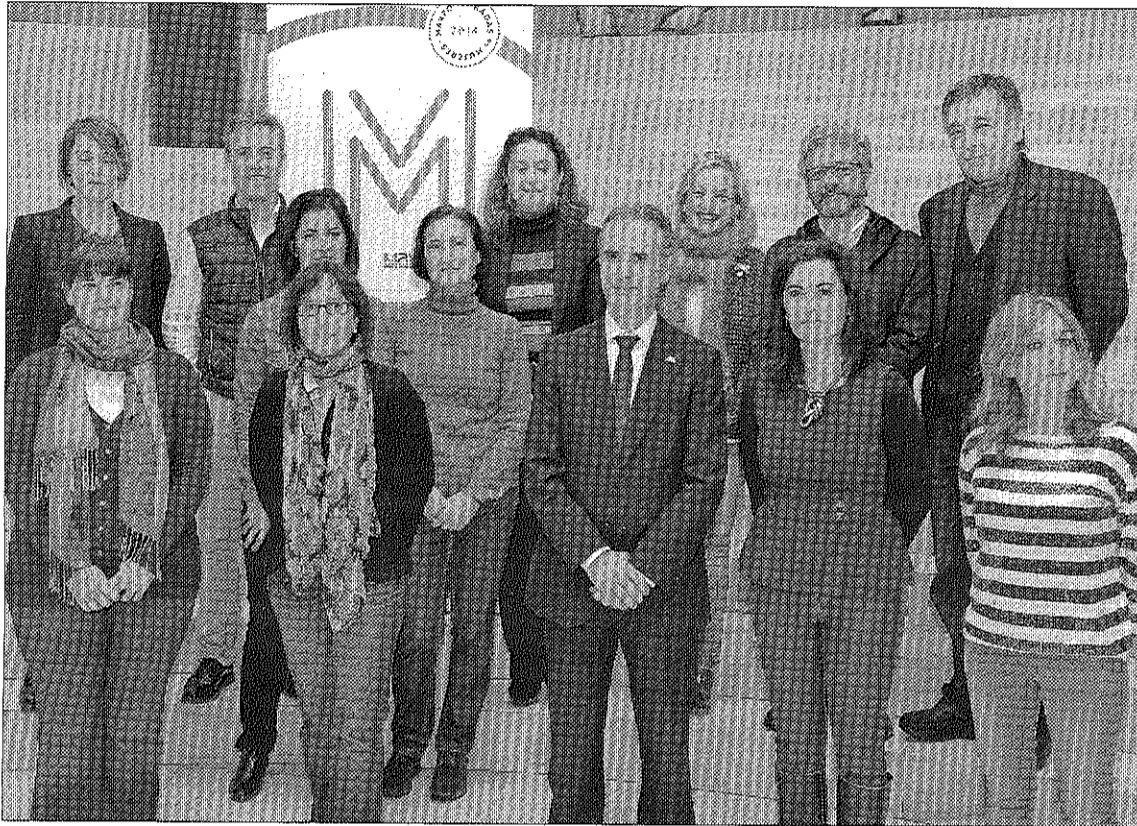
Presentación de 'Miradas de mujeres' en el Palacio de Festivales.