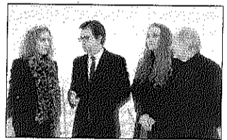
Momento de la presentación.