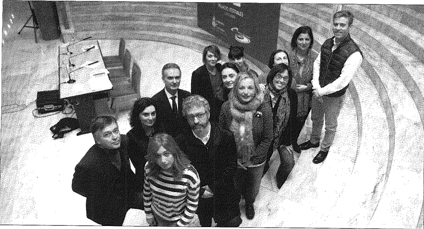
Autoridades, organizadores y artistas, tras la presentación del festival en Cantabria.