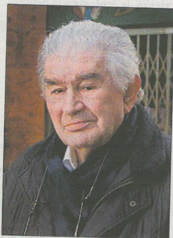
Antonio Gamoneda.

En el género ensayístico cabe resaltar El cuerpo de los símbolos (Memoria, poética, ensayo) o Valente: texto y contexto . Ha publicado asimismo la autobiografía Un armario lleno de sombra (Galaxia Guten-