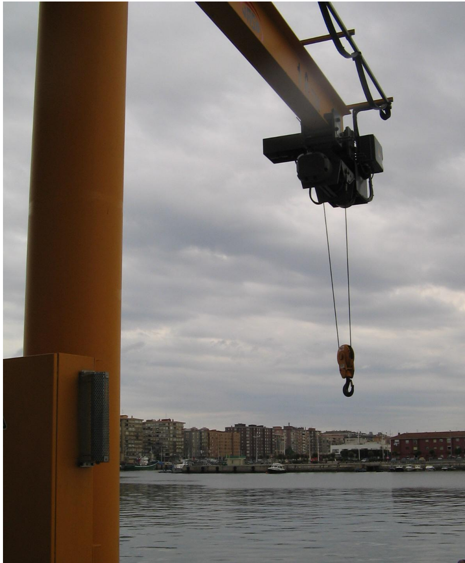
Figura 3.- El brazo útil de la grúa es de 4 metros