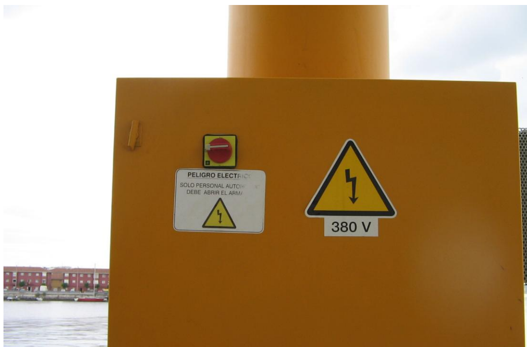
Figura 2.- Cuadro eléctrico de la grúa de 1.6 Tn.

Medidas Preventivas: Abstenerse de realizar cualquier tipo de manipulación en el interior del cuadro eléctrico de la grúa. Cualquier anomalía deberá notificarse a personal de la Autoridad Portuaria de Santander, para que esta sea subsanada por personal autorizado y cualificado.