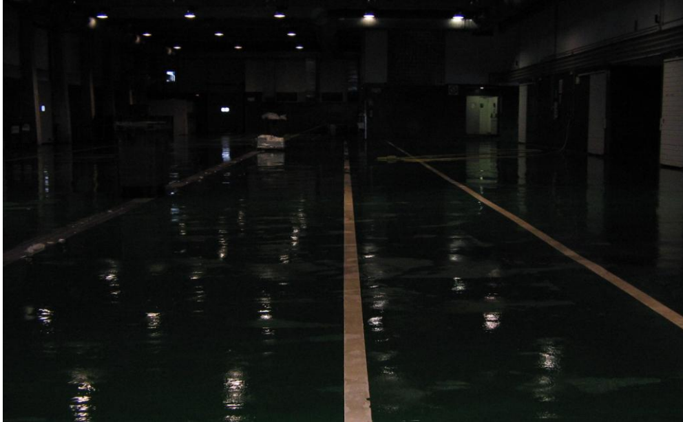
Figura 4.- Cancha de la Lonja