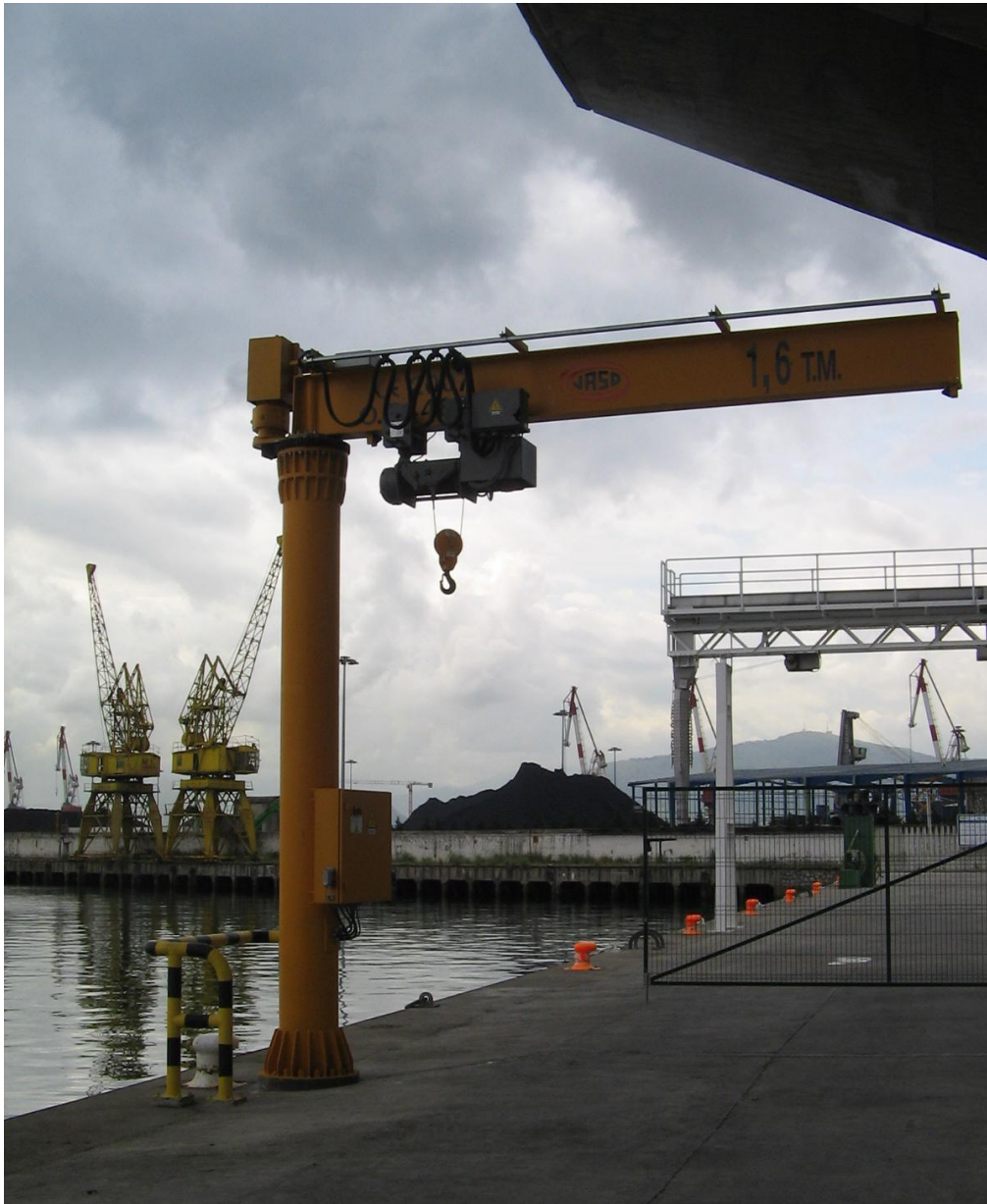
Figura 1.-Grúa de 1.6 Tn. instalada en el Muelle de la Lonja