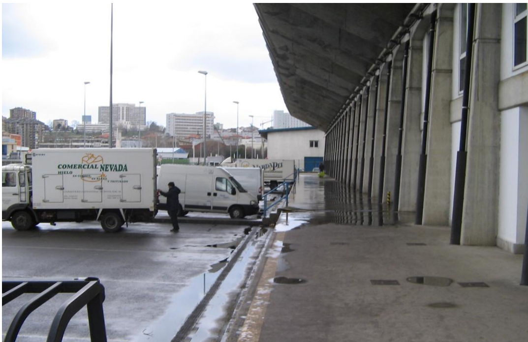
Figura 6.- Muelle de descarga de la Lonja